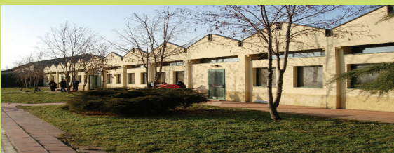
Il Centro Diurno Arcobaleno

Lavora inoltre in collaborazione con l'Associazione Comunità Emmaus, la Cooperativa Sociale Memphis, la Caritas Diocesana, l'Associazione Carcere e Territorio, altri enti accreditati, il Cegest, l'Asl della provincia di Bergamo, i servizi di integrazione e inserimento lavorativo, le aziende del territorio.